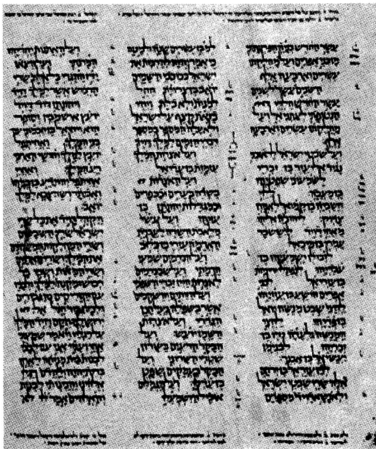
כתר אר"ן, דהיא כו יד-כח ג