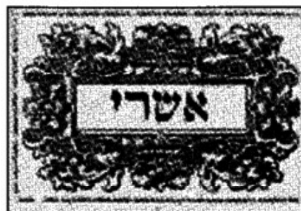
מקראות גדולות, קהילת משה, אמשטרדם

כל־ממלכות הארץ נתן לי ה' אלהי השמים והוא־פקד עלי לבנות־לו בית בירושלם אשר ביהודה, מיבכם מכל־עמו ה' אלהיו עמו ויעל (לו כג).