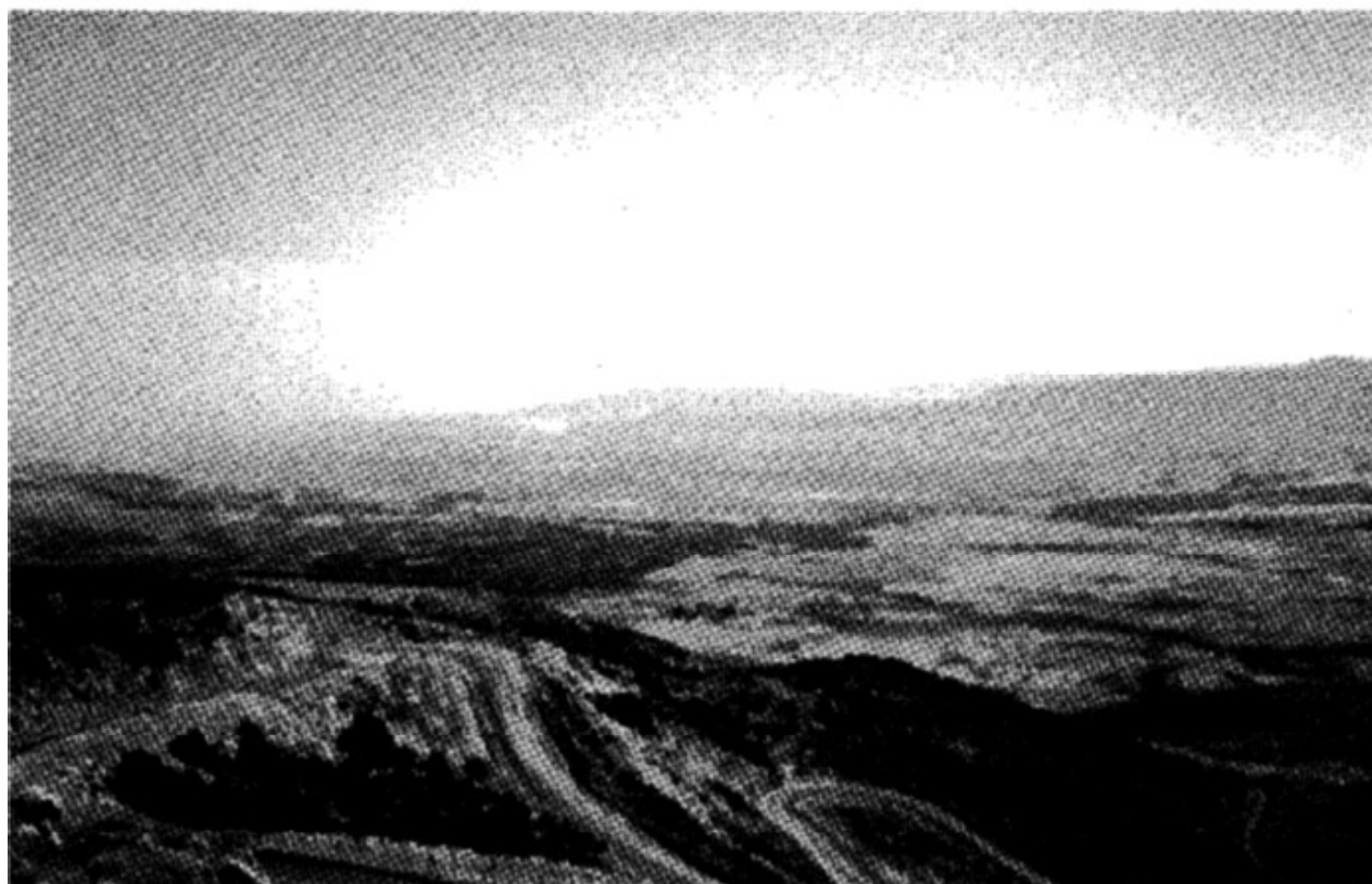
בקעת הלבנון (צילום מהר דב)

ואשביעך בה' אלהי השמים ואלהי הארץ, אשר לא־תקח אשה לבני מבנות הכנעני אשר אנכי יושב בקרבם (כד ג); והתחתנו אתנו, בנתיכם תתנר־לנו ואת־בנתינו תקחו לכם... ונתנו את־בנתינו לכם ואת־בנתיכם נקח־לנו, וישבנו אתכם והיינו לעם אחד... את־בנתם נקח־לנו לנשים ואת־בנתינו נתן להם (לד ט-כא).