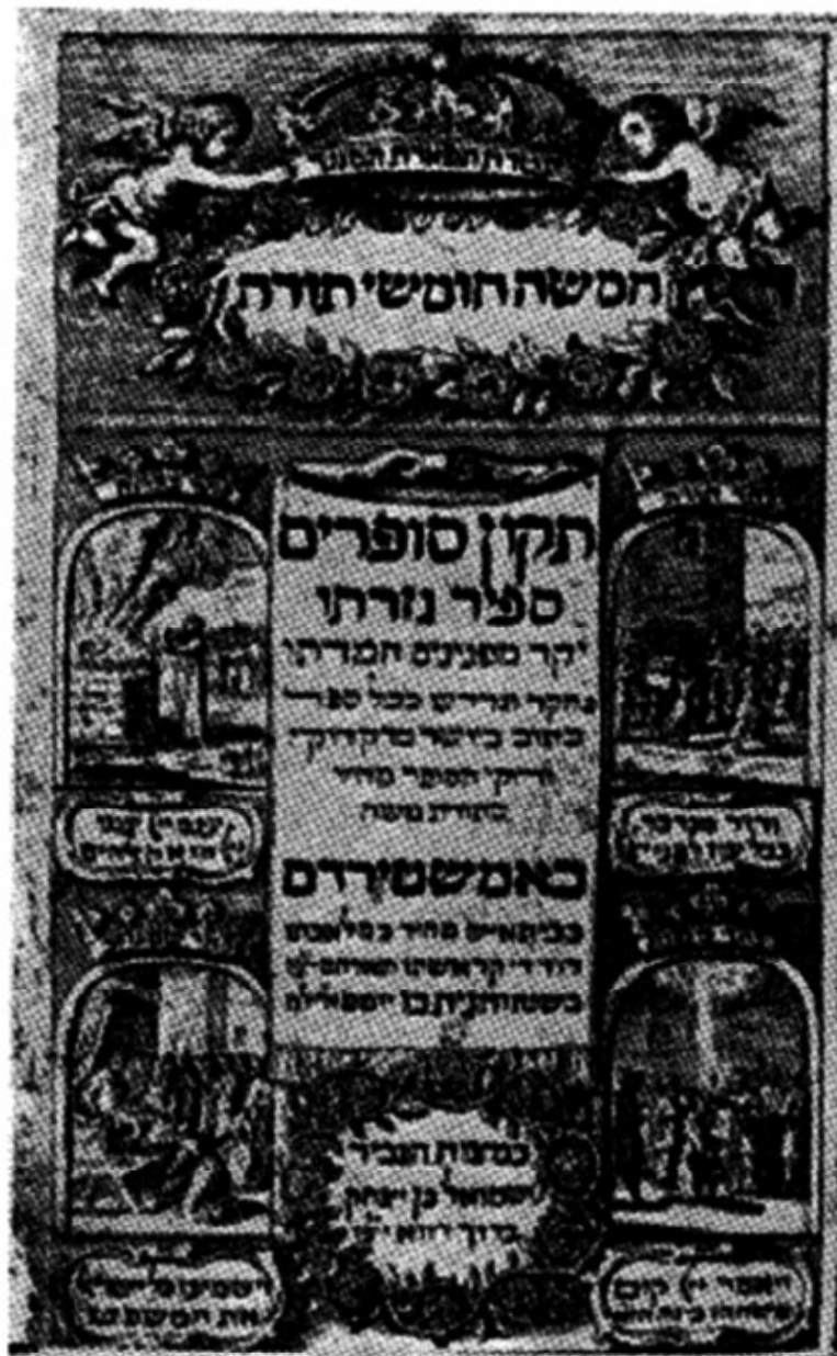
שער 'תקן סופרים', אמשטרדם תכ"ו

כיגדול מרדכי בבית המלך ושמעו הולך בכלהמדינות, כיהאיש מרדכי הולך וגדול (ט ד).