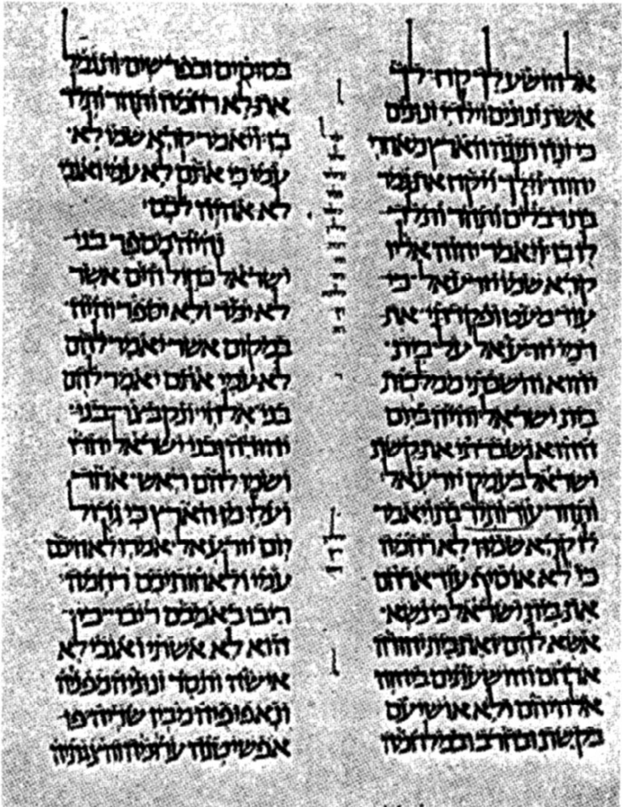
הושע (בביקור עליון)

וירחה לכם יראי שמי שמש צדקה ומרפא בכנפיה, ויצאתם ופשתם כעגלי מרבק (ג כ).