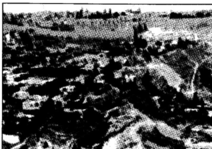
המדרון המזרחי של עיר דוד

שִׁישִׁי וּשְׂמָחִי בַת־אָדוֹם יוֹשְׁבַת (קרי) בָּאֶרֶץ עוֹץ (ד כא).