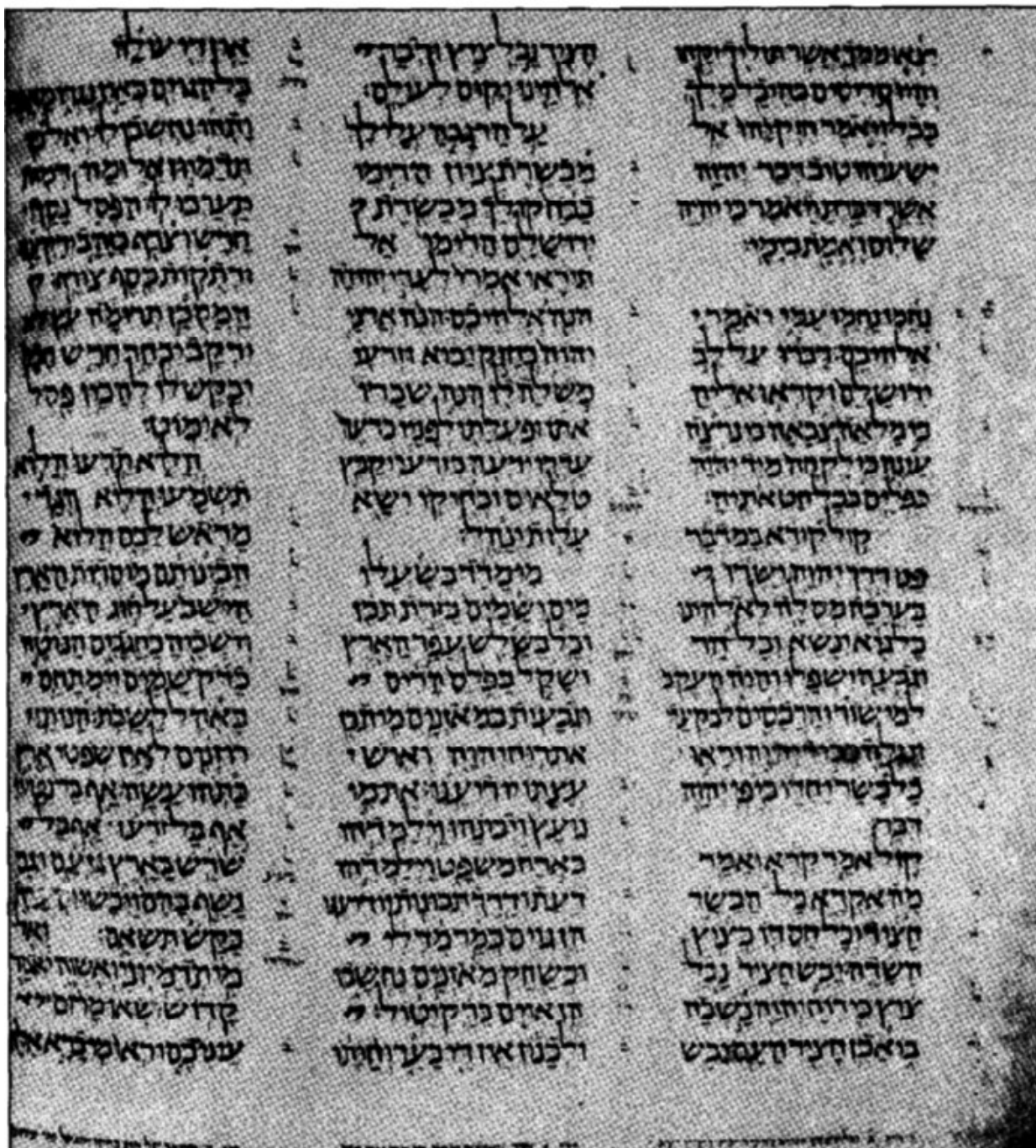
כתר אר"ץ (יש לטו - מכו)

נשא... בשנת מלכו את-ראש יהויכין מלך- יהודה מבית כלא (כה כו).