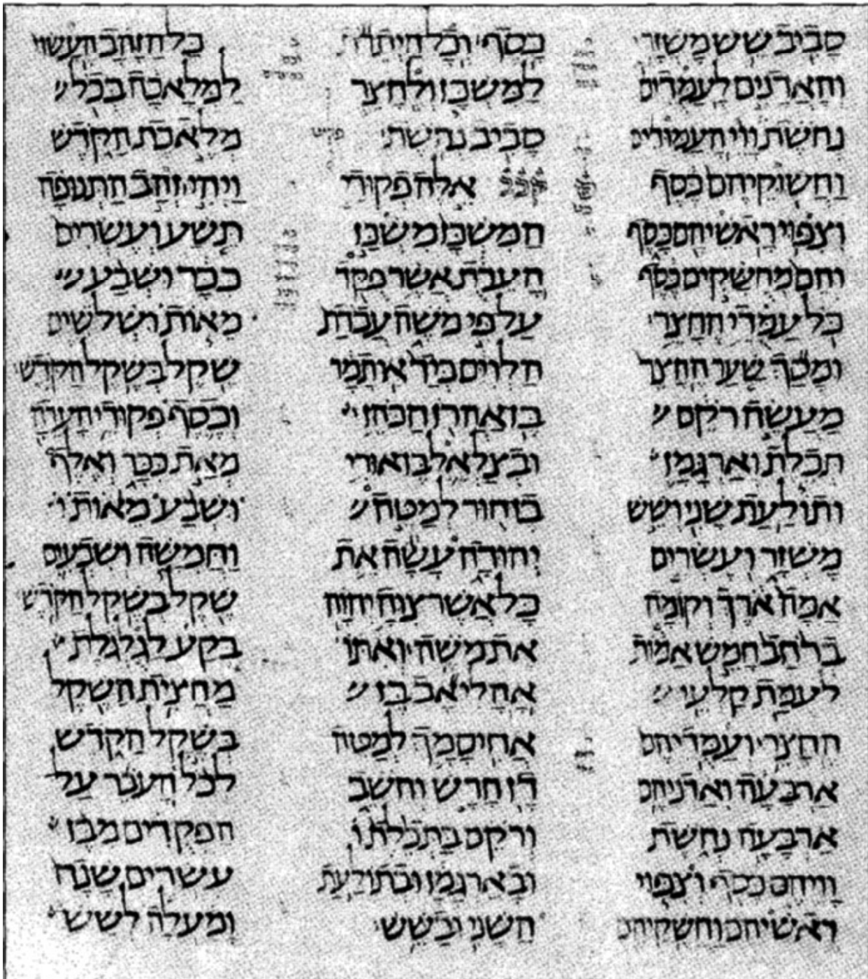
כתר דמשק, מאוסף ששון