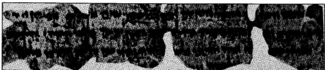
מגילות ים־המלח (ש"ב כג ט-יב)

ויבאו אותם אל־המחנה שלה (כא יב); ולא ימחה שבט מישראל (כא יז); הנה חג־ה' בשלו (כא יט); יצאו בנות־שילו... וחטפתם לכם איש אשתו מבנות שילו (כא כא).