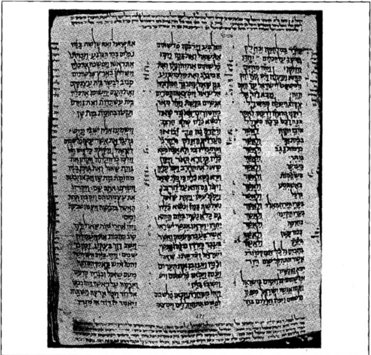
כתב יד ששון (ש"א ל כד - ש"ב א ג)

ויבן שם מזבח לה' (יב ז, ועוד כיוצא בזה). ויבן שם דוד מזבח לה' (כד כה).