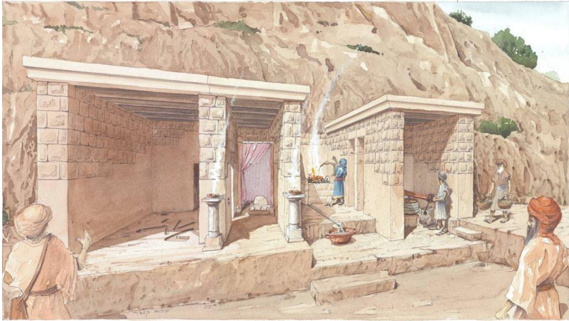
איור: שלום קוולר, באדיבות ארכיון עיר דוד.