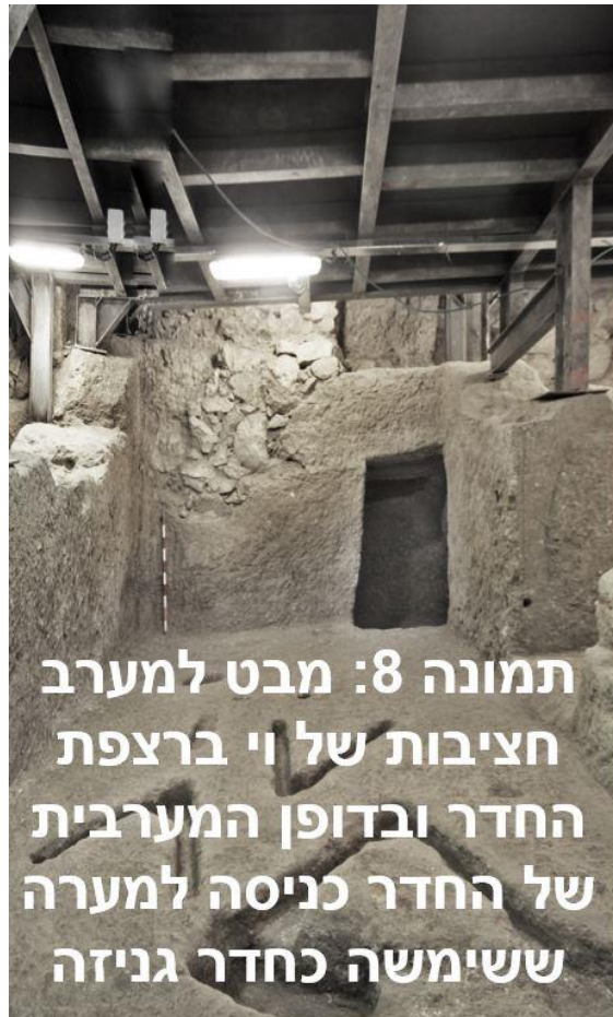
תמונה 8: מבט למערב חציבות של וי ברצפת החדר ובדופן המערבית של החדר כניסה למערה ששימשה כחדר גניזה