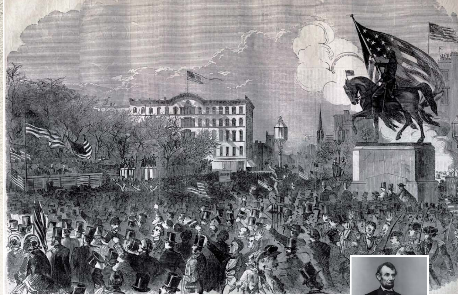
מסגן תמיכה בממשלה, בשנת 1861

גדול חכמי יוון, אריסטו, עיגן את העבדות בחוקי הטבע כפי שהבינם: "אנשים אלו, הנחותים מאחרים כנחיתות הגוף מהנפש... תפקידם השימוש בגופם, תחום שבו הם מוצלחים ביותר... הם עבדים לפי טבעם, וטוב להם יותר להיות נשלטים באופן תמידי..." (אריסטו,