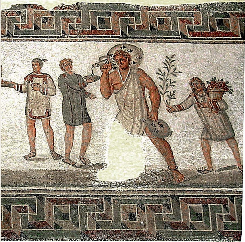
שני עבדים חמיים בלבשו אופייני וכדי יין על כתפיהם (פסיפס, האתר הארכיאולוגי דוגה צפון-מערב תוניסיה)

כמשך דורות רבים לא היו העבדים מצויים כל כך אצל בני ישראל, ורק בתקופה הרומית, כשהרומיים נהלו בפועל את הכלכלה בארץ ישראל - חדרה העבדות לארץ, ואצל הרבה מגדולי חכמינו אנו מוצאים עבדים (ואף על פי כן קבעו חכמים 'עבד מילתא דלא שכיחא', ראה גיטין מד, א). אך בולט הדבר שהיחס אליהם כבני אדם מושרש היה בקרב העם. ועם כל דברי הגנות הרבים שנאמרו על העבדים