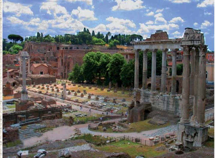
פוזום רומאנוס, מרכז רומא העתיקה