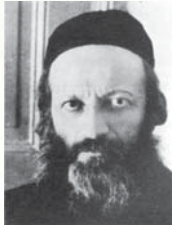
רבי אברהם יצחק הכהן קוק זצ"ל

רבי אברהם יצחק הכהן קוק מסכים איתו, לפחות במישור פרשנות המציאות שבדיעבד: "ודע יקירי, שכל הדברים ההיסטוריים שהיו במציאות צריכים שיובנו על פי תעודותיהם, עם הדברים המסובכים מהם בהשגחת ד', לכוון הטוב והחסד באחרית. וכיוון שאנו רואים שהרבה עבדים יצאו מגזע חם יותר משני הגזעים האחרים, אנו מכירים שלתכלית ההשלמה הכללית - היו הם ראויים לעבדות, ולו התרוממו לחירות בלא עת, פעלו