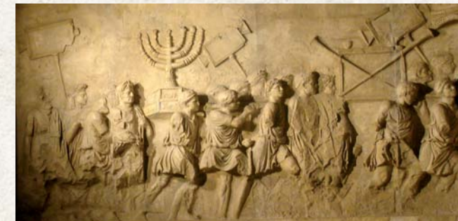
שבויים יהודים מובלים מייחשלים לחזא, לאחר חורבן הבית. קטע מתוך שער טיטוס

אך ככל הידוע לנו על עבדים בתרבויות הקדומות, בכבל, בארם, בכת, ובשאר העמים הקדומים במזרח לא היו העבדים גורם משמעותי בכלכלת המדינה, כפי שקובע אחד ההיסטוריונים: "המבנה הכלכלי במזרח הקדום לא תיב ריכוז רב של כוח עבודה, מהעדר חטיבות כלכליות רבות היקף כחורשת וכתחבורה הימית ביוון הקלאסית, וכלאופיטופונדיות (=חות גדולות) ברומא" (ז' רובינוון, 'מלחמת אריסטוניקוס', ספר זכרון לפרופ' ב' כץ, 1971, עמ' 159 והלאה). במדינות אלו בהחלט היו הבדלי מעמדות, והחוקים התייחסו אל בני מעמדות שונים כנחותים זה