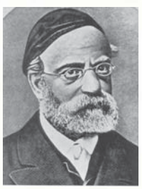
רבי שמשון רפאל הירש זצ"ל

רבי שמשון רפאל הירש, לעומת זאת, נותן הצדקה לעבדות של בני חם: "רבה המהומה בעולם ממעשי ידיו של חם... הרי אלו אומות היוצאות לכבוש, להאביד ולהרוס, לאכול ולשתות. אומות הולכות ובאות, וכל עצמן אלימות גסה, חושניות, בהמיות... אם נתבונן עתה במציאות ההיסטורית, נוכל לומר: שיא הפריחה של יפת הוא יוון; שיא הפריחה של שם הוא עבר, העם העברי, עם ישראל, הקורא בשם ה' בין אומות העולם. עד היום הזה - רק מיפת