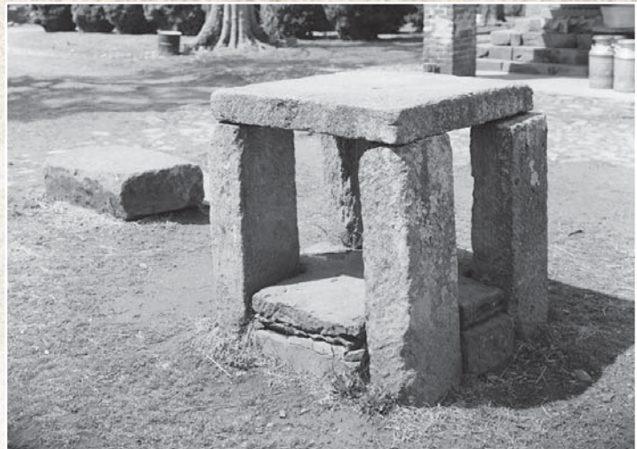
אבן ממזר לעבדים, גרין-היל, וירג'יניה

פוליטיקה, ספר ראשון, פרק המישי, 1254). ובמקום אחר: "אין מקום לידידות ולצדק כלפי חסרי חיים, ואף לא כלפי סוס או שור, וגם לא כלפי עבד, כי אין שום דבר משותף ביניהם. העבד הוא מכשיר חי והמכשיר הוא עבד חסר חיים" (אתיקה ניקומאכית, 1161).