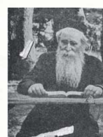
ר' הלל צייטלין הי"ד

ב"אגרות אל הנוער היהודי" כתב הלל צייטלין: "ככל שמדינה (בעולם העתיק) התעצמה, ככל שעלתה במעלת התרבות, כן נאלצה להרכות במלחמות כדי לרכוש עבדים, וכן הלך והידרדר יחסם של האדונים אל עבדיהם המעונים. קאוטסקי וחוקרים אחרים הוכיחו בעליל שהציוויליזציה הרומית הייתה כולה מיוסדת על מלחמות בלתי פוסקות, שפרצו בעיקר בגלל הצורך לספק יותר ויותר עבדים בשביל הייצור ההמוני, וככל שגדל המשק והתפתחה התעשייה - כן נעשה מצב העבדים בלתי נסבל וקשה ללא נשוא.