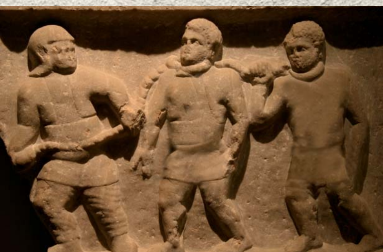
חבלית שיש-עבדים הנמיים מובלים כשקולד על צווארם

שאינן ידם משגת לפרנס את עצמם ומוכרים את עצמם מרצונם לעבדות (כפי שמורה המשך הכתוב העוסק במקרה ההפוך - ישראלי שהעני ומכר את עצמו לגר תושב). בשום מקום לא התירה התורה מסעות צייד אדם וסחר בנפשות. להיפך, נאמר (דברים כג, טז-יז): ”לֹא תִסְגֵּר עֶבֶד אֶל אֲדֹנָיו אֲשֶׁר יִצַּל אֲלֵיךָ מֵעַם אֲדֹנָיו: עִמָּךְ יֵשֶׁב בְּקִרְבְּךָ בְּמָקוֹם אֲשֶׁר יִבְחַר בְּאַחַד שְׁעָרֶיךָ בְּטוֹב לוֹ לֹא תוֹנְנוּ” . ואילו ”וְגִבַּב אִישׁ וּמְכָרוֹ וְנִמְצָא בְיָדוֹ - מוֹת יוֹמָת” (שמות כא, טז). אמנם התורה מפרשת כי עונש זה נאמר רק בגונב מבני